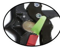
실리콘 노즐 절단