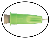
경화된 실리콘 제거용 핀