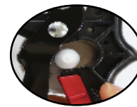
실리콘 카트리지 꼭지 절단