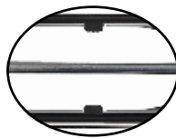
카트리지 nonslip 홀더