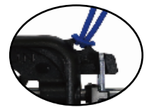
건 낙하 방지용 줄고리